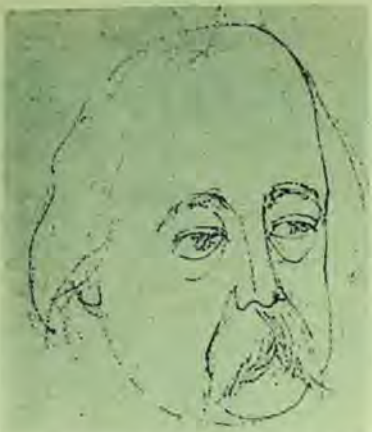
Gustave Flaubert — portret de Cik Damadian

zărit de mult citeva din adevărurile cîştigate ale documentologiei moderne.