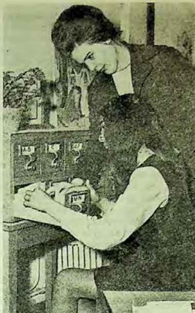
Inițierea în „tainele” catalogului de bibliotecă