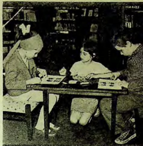
Învăță jucându-se și se joacă învășind...