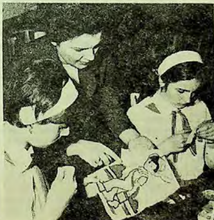
Bucuria creației... „Cu acul și așă”, după modele din carte