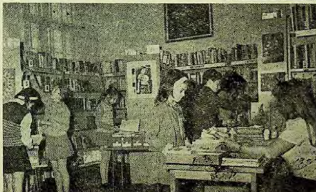
„Cei mari” preferă să citească