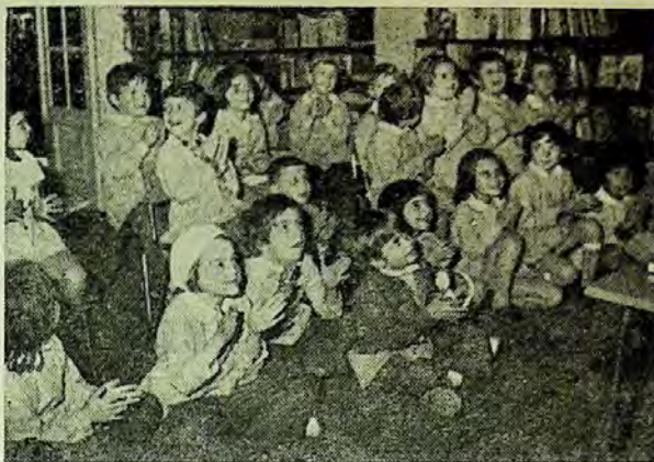
Succes de public... la un teatru de păpuși la care copiii sînt și realizatori și spectatori.