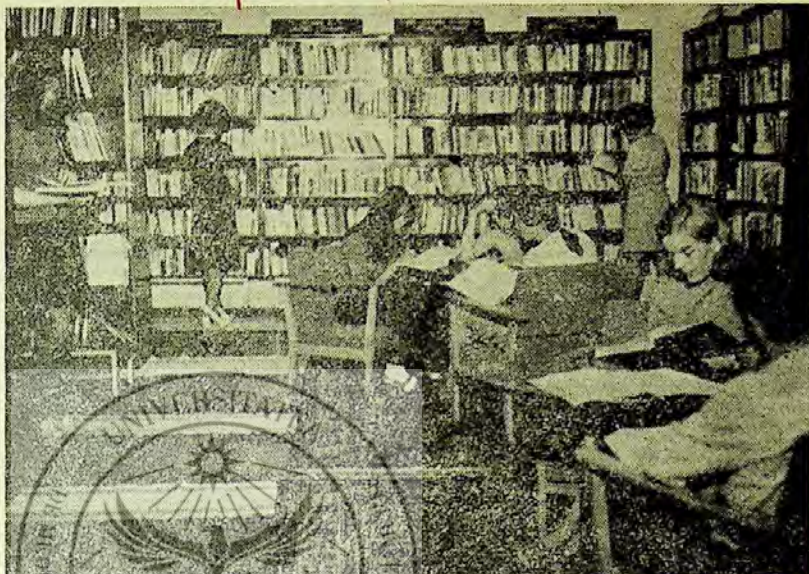
Biblioteca județeană Suceava