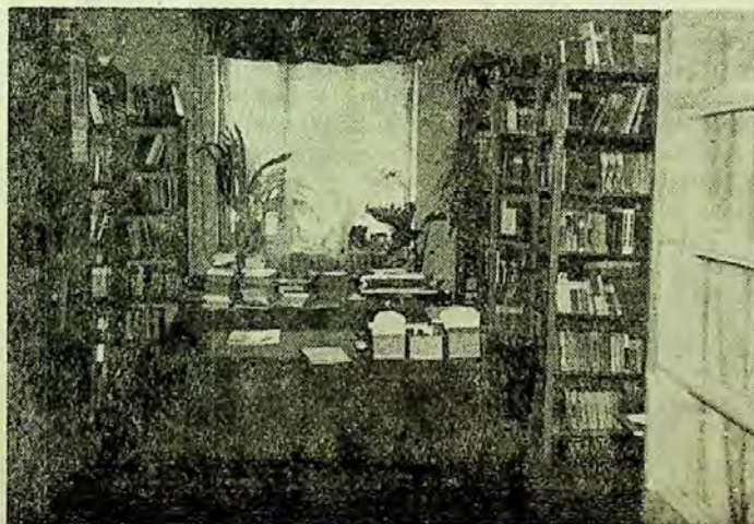
Imagini contrastante în județul Dolj: Biblio- teca comunală Dăbuleni (stînga, jos) și Biblio- teca comunală Sadova (dreapta).