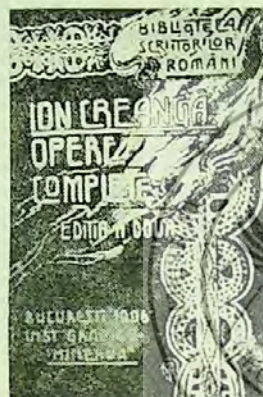
București, „Minerva”, 1906.