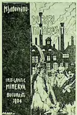
București, Minerva, 1904.