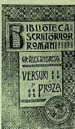
București, „Minerva”, 1902 (legătură bibliofilă).