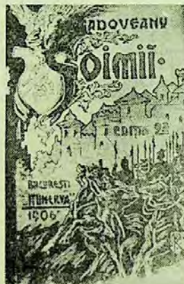
București, „Minerva”, 1906.