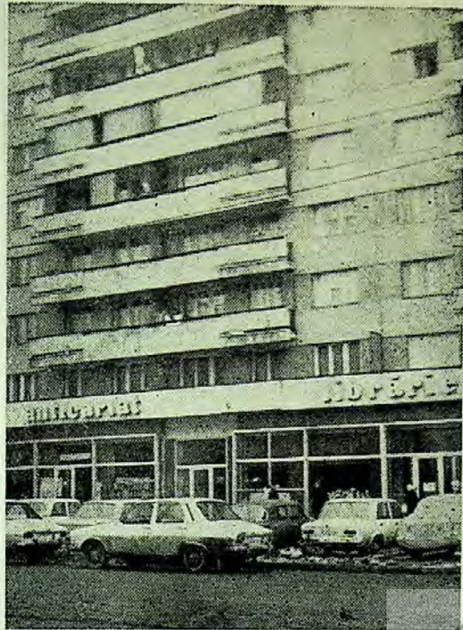
Aspect din interiorul bibliotecii: mai mult stivă de cărți, decât acces liber la raft (p.20). Anticariat, librărie... Pe cînd și o bibliotecă modernă pe modernul Bulevard 1 Mai? (p. 21).

carei le-ar putea asigura într-un cadru adecvat activității de bibliotecă. Cei 16 mp continuă să se încerce și să se supraîncerce cu carte, greu accesibilă în condițiile proprii mai degrabă depozitării în stivă decât organizării accesului liber la raft și departe de orice normă de conservare a fondului de publicații și de protecție împotriva incendiilor.